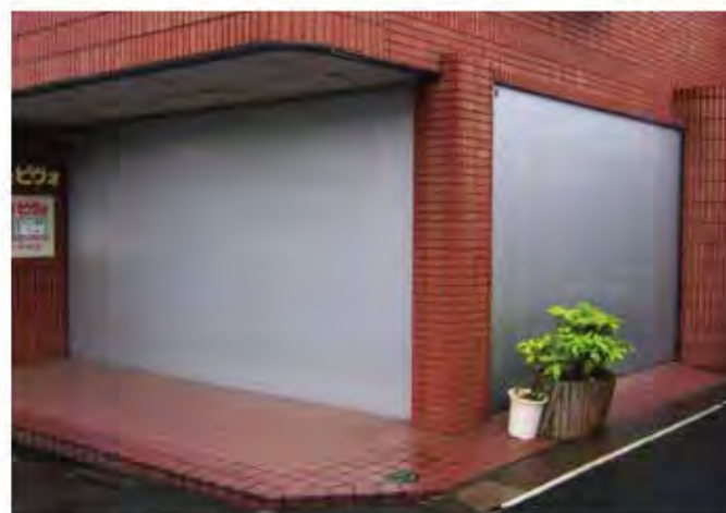
W4,000×H2,700 アルミ製(シルバー) 電動式、片引き仕様、BOX型