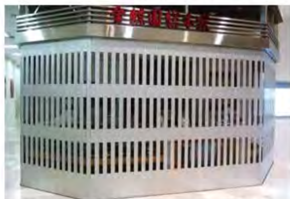
W7,300×H2,500 アルミ製(シルバー) 通風タイプ 手動式、片引き、BOX型、曲げR=200×2カ所