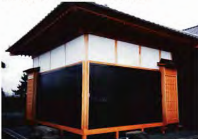
W2,700×H2,400 アルミ製(ダークブラウン) 電動式、片引き仕様、BOX型、2カ所