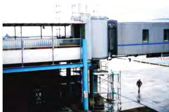
W1,500×H3,500 アルミ製(シルバー) 電動式、片引き仕様、流し込み型、全体R=2,000