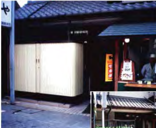
W3,000×H1,200 スチール製(アイボリー塗装) 手動式、両引き仕様、BOX型