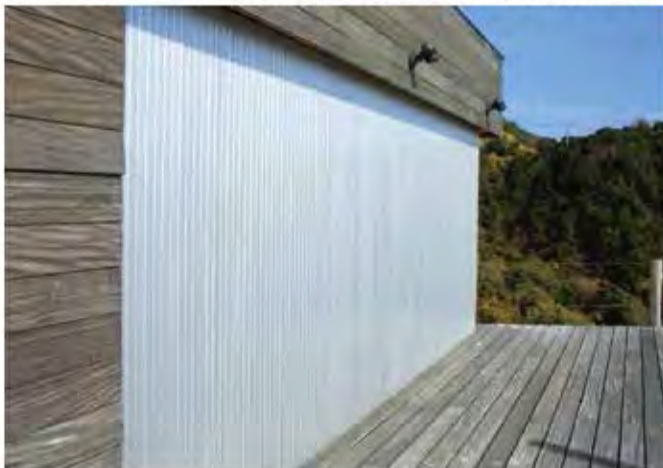
W9,000×H2,700 アルミ製(シルバー) 電動式、片引き仕様、BOX型、 曲げR=300