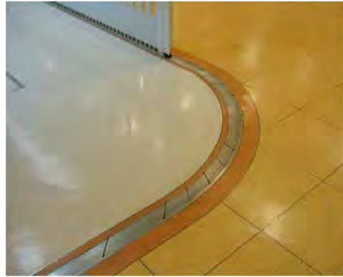
W15,200×H2,800 アルミ製(ホワイ) 電動式、片引き、BOX型、アミーダ仕様