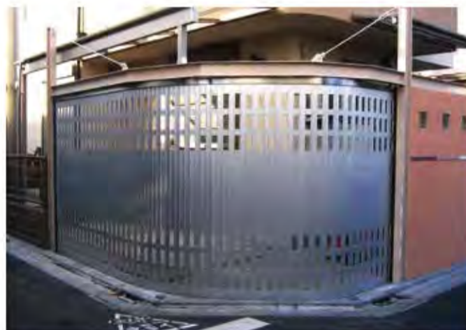
W5,200×H2,300 アルミ製(シルバー) 手動式、片引き仕様、BOX型、曲げR=300×2カ所