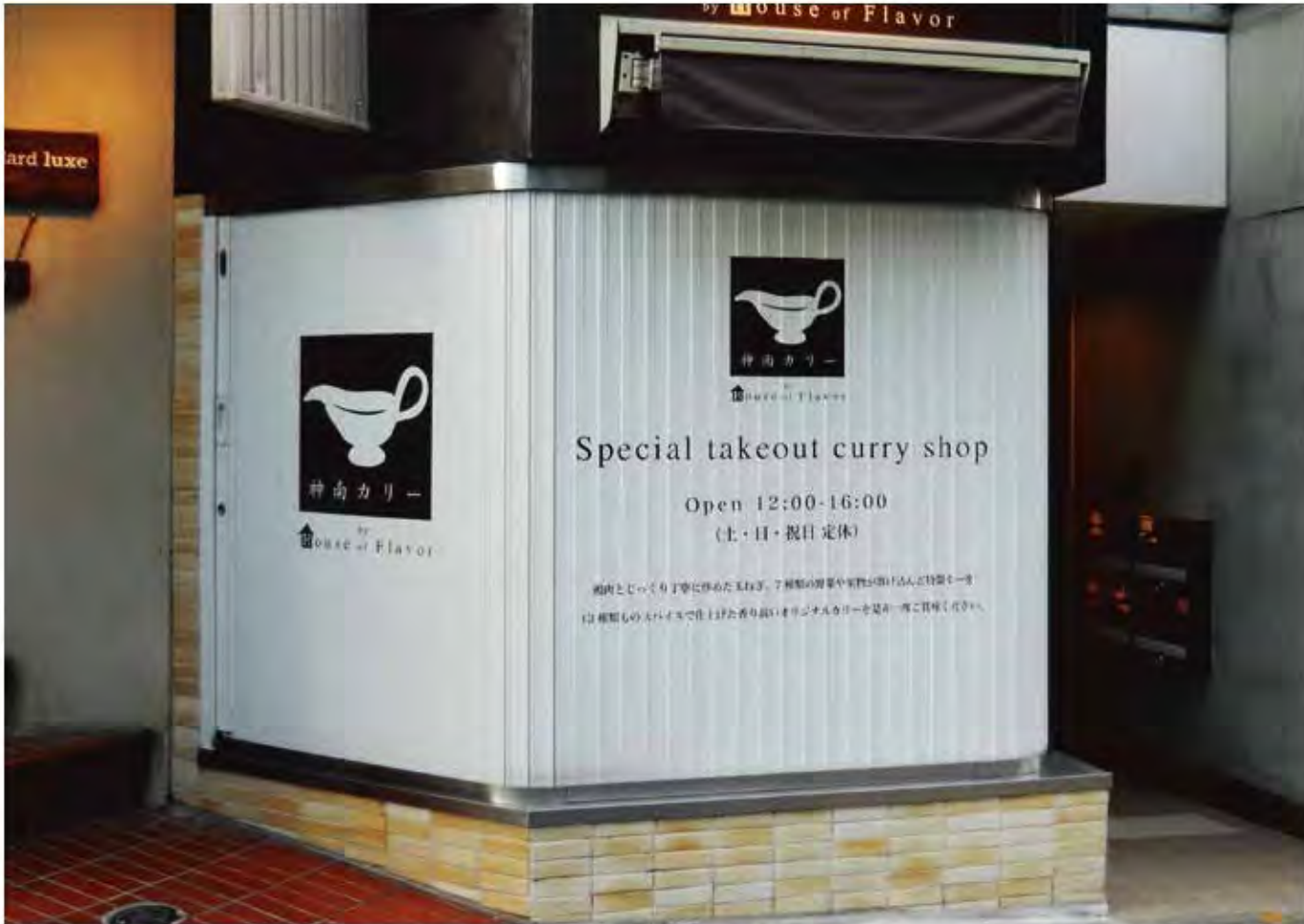
W4,800×H1,500 アルミ製(ホワイト) 手動式、片引き仕様、BOX型、曲げR=200