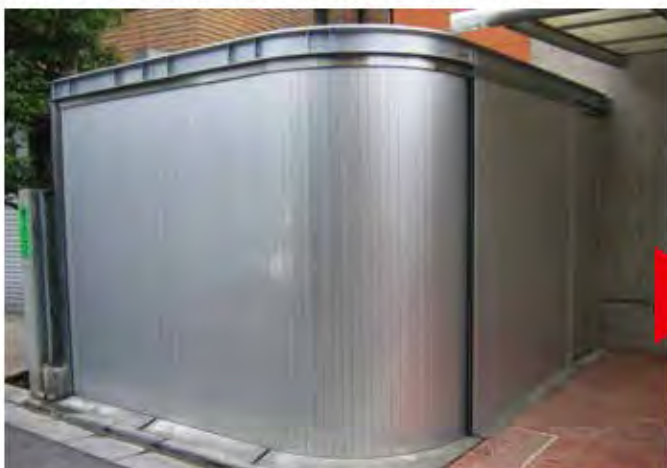
W3,100×H2,200 アルミ製(シルバー) 電動式、片引き、BOX型、曲げR=600