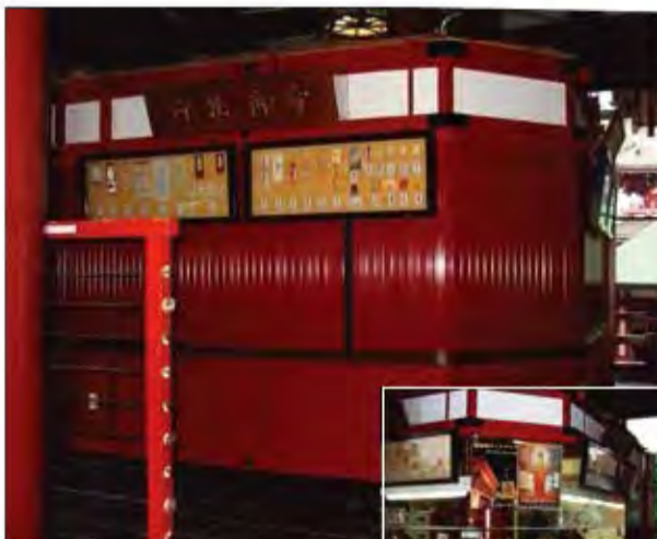
W5,900×H1,500 アルミ製(指定色:朱色) 電動式、両引き、BOX型