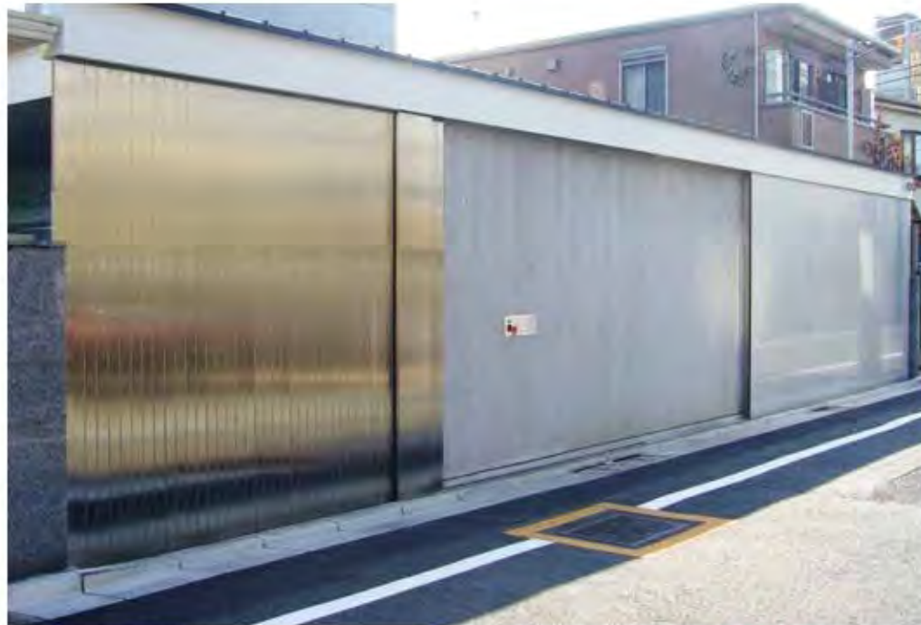
W3,000×H3,000 ステンレス製、電動式、片引き仕様、流し込み型、 防火戸仕様