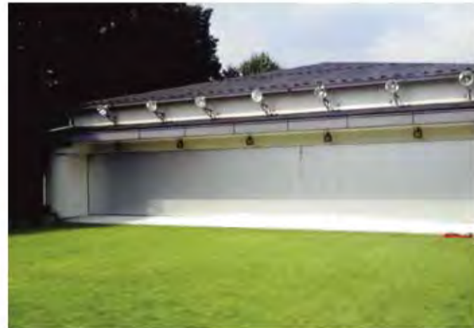
W14,000×H2,500 アルミ製(シルバー) 手動式、両引き分け仕様、BOX型