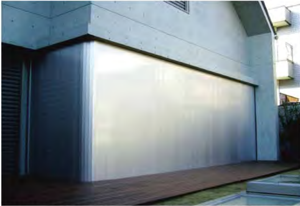
W7,000×H2,700 アルミ製(シルバー) 電動式、片引き仕様、BOX型、曲げR=300