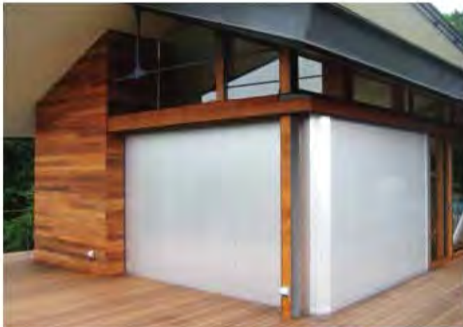
W7,200×H2,500 アルミ製(シルバー) 電動式、片引き仕様、BOX型、曲げR=300