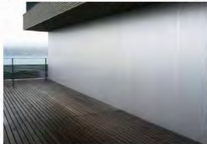
W11,000×H2,700 アルミ製(シルバー) 電動式、片引き、BOX型、曲げR=300