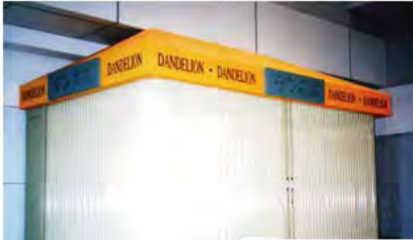
W6,600×H2,400 スチール製(アイボリー塗装) 手動式、両引き仕様、流し込み型 t=0.8、防火戸仕様