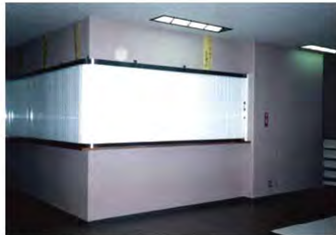
W8,000×H1,000 アルミ製(ホワイト) 手動式、片引き仕様、BOX型、曲げR=200