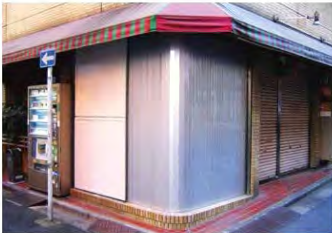
W2,300×H2,700 アルミ製(シルバー) 手動式、片引き仕様、BOX型、曲げR=300