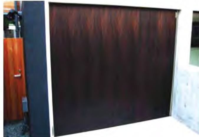
W2,500×H2,300 アルミ製(ダイノックシート貼り) 電動式、片引き仕様、流し込み型