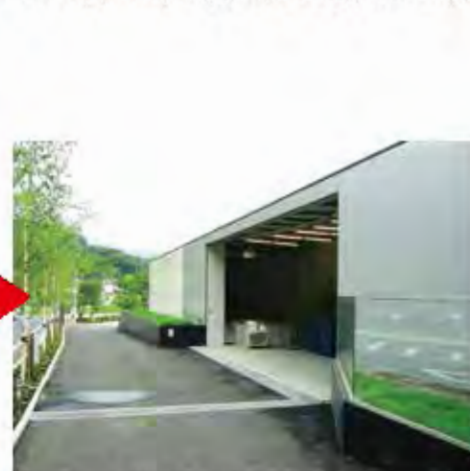
W10,185×H3,800 アルミ製(ブラック・シルバー2色特殊仕様) 電動式、片引き仕様、BOX型 ※「ブラックL=600」+「シルバーL=3,200」=TH3,800