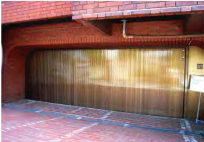
W6,000×H1,900 アルミ製(ブロンズ) 電動式、片引き仕様、BOX型