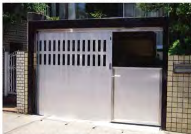
W2,700×H2,200 アルミ製(シルバー) 手動式、片引き仕様(くぐり戸付き)、流し込み型、曲げR=200