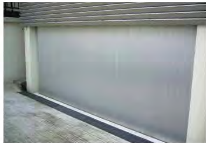
W4,000×H2,300 アルミ製(シルバー) 電動式、片引き仕様、流し込み型