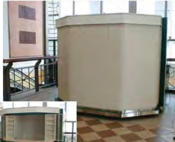
W3,800×H2,200 アルミ製(指定色:ページュ) 手動式、片引き仕様、BOX型