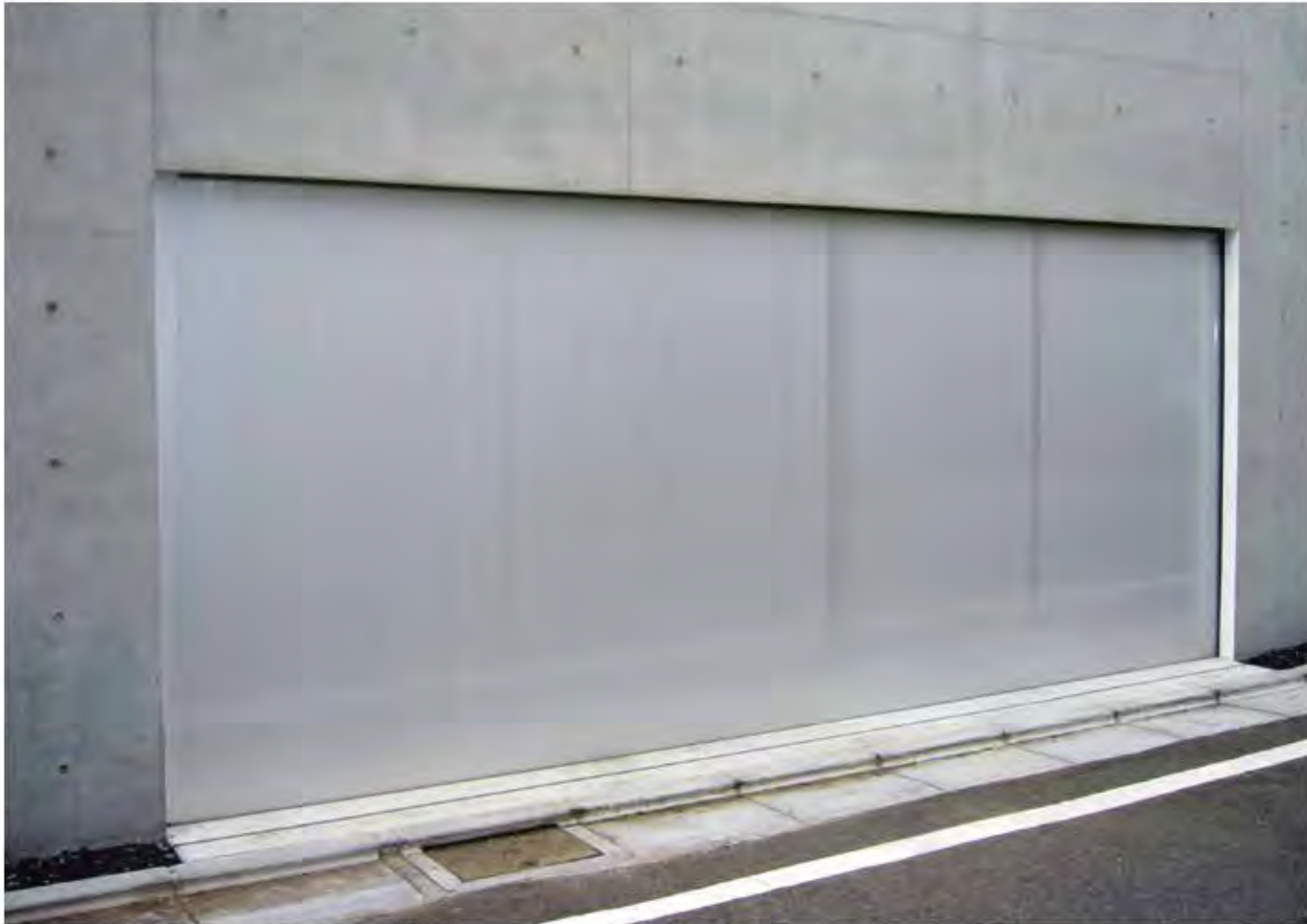
W5,000×H2,300 アルミ製(シルバー) 電動式、片引き仕様、BOX型