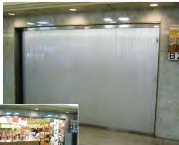
W3,000×H2,100 アルミ製(シルバー) 電動式、片引きBOX型