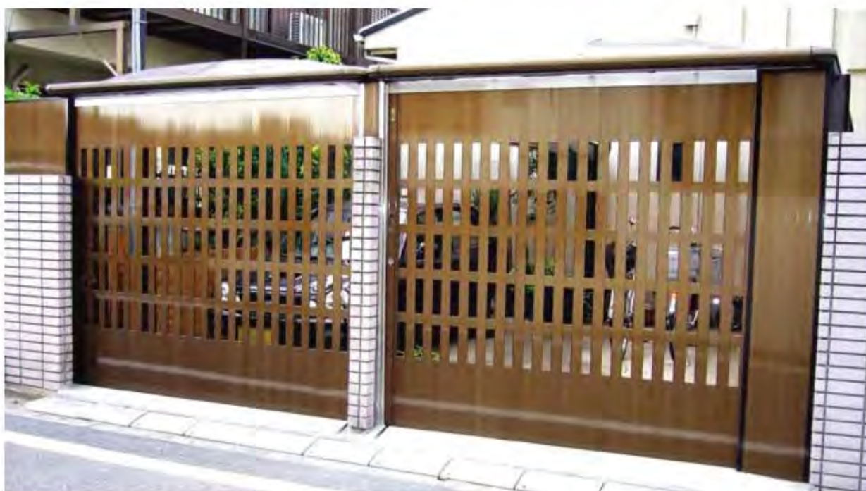
W2,200×H2,100 アルミ製(ブロンズ) 手動式、片引き仕様、BOX型、2カ所