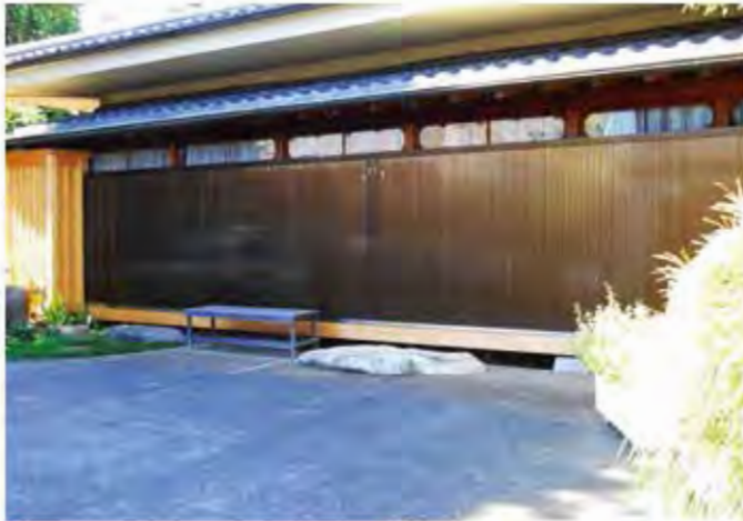
W9,000×H2,100 アルミ製(ブロンズ) 電動式、片引き、BOX型