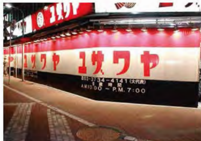
W11,000×H2,500 アルミ製 電動式、片引き仕様、BOX型、曲げR=300