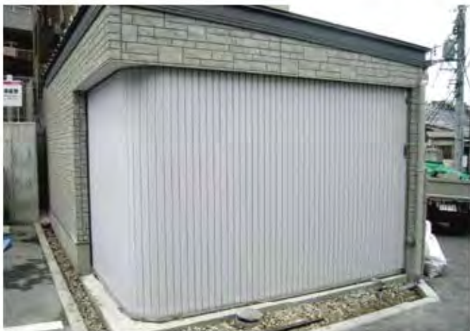
W4,000×H2,300 スチール製(指定色:ページュ) 手動式、片引き仕様、流し込み型、 t=0.8 、 防火戸仕様