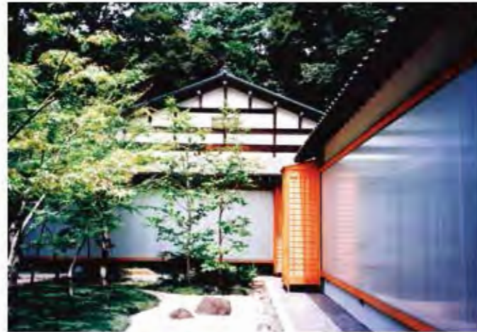
W8,000×H2,300 アルミ製(シルバー) 電動式、片引き仕様、BOX型