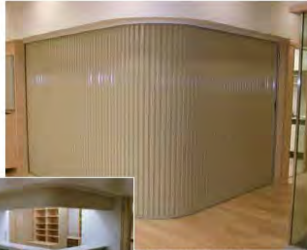
W5,500×H2,700 スチール製(ページュ塗装) 手動式、片引き仕様、BOX型 t=0.8、防火戸仕様