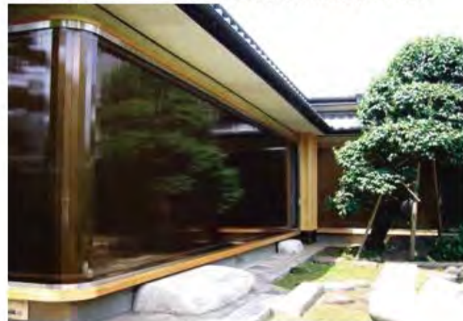
W11,000×H2,300 アルミ製(ブロンズ) 電動式、片引き仕様、BOX型、 曲げR=450