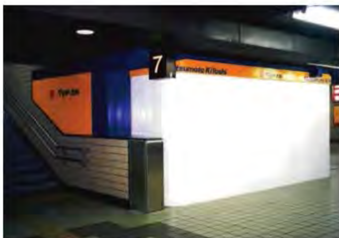
W8,000×H2,300 アルミ製(ホワイト) 手動式、片引き仕様、BOX型、曲りR=300