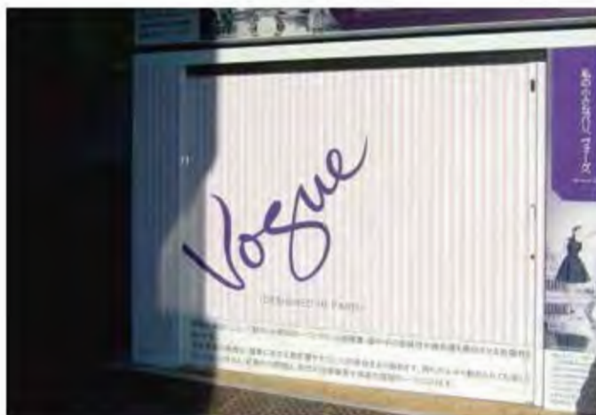
W2,500×H2,100 アルミ製(カッティングシート貼り) 手動式、片引き仕様、BOX型