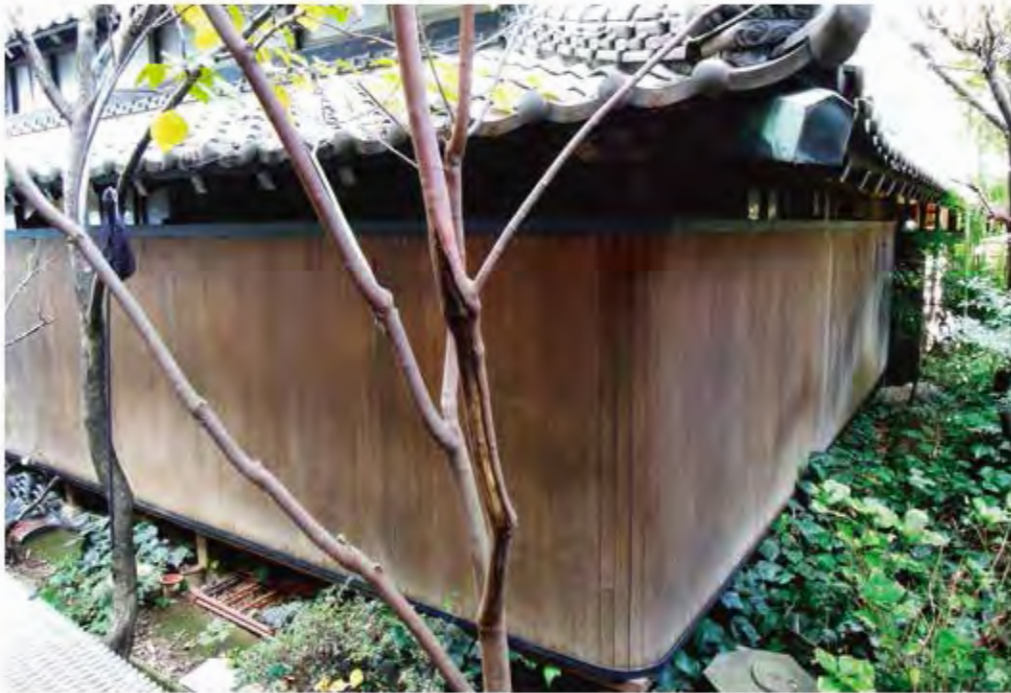
W15,000×H2,300 アルミ製(木製シート貼り) 電動式、片引き仕様、BOX型、曲げR=200